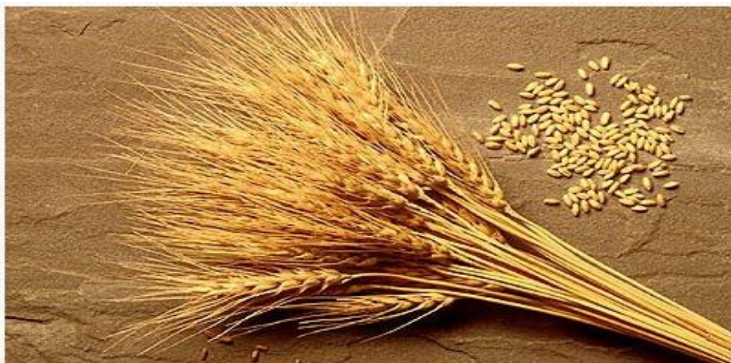
Рис культивують перш за все в країнах Південної, Східної та Південно-Східної Азії (90 % світового збору). Посіви рису є також у Центральній Азії, південних районах Європи, на півдні Північної Америки та в окремих регіонах Південної Америки. Найбільшими виробниками рису є Китай та Індія (дають понад половину світового врожаю), В'єтнам, Корея, Індонезія, Бангладеш, Таї-

Світове виробництво зерна щороку складає понад 2 млрд т, у тому числі близько 600 млн т пшениці . Експорт пшениці виявився сконцентрованим у руках порівняно невеликої групи країн — США (50 %), Канади, Франції, Австралії, Аргентини. Великими імпортерами зерна (більше 50 % світового імпорту) є країни, що розвиваються. Вони ввозять головним чином продовольче зерно. Наприклад, Єгипет завозить щороку близько 10 млн т зерна, Бразилія — 5 млн т, Японія — 30 млн т, Росія — 27-35 млн т. До імпортерів належать також Великобританія, Німеччина, Нідерланди, Швейцарія, Китай.